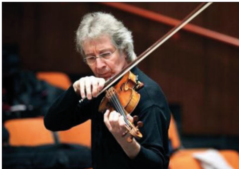
Le célèbre violoniste Pierre Amoyal se produira au Temple d'Yverdon-les-Bains, dimanche, dès 19h, en compagnie de la Camerata de Lausanne.