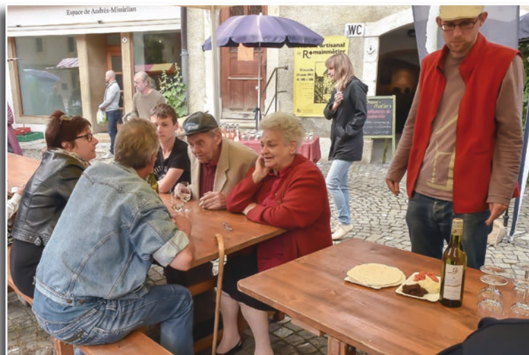
Un coin permettait de prendre l'apéritif en famille.