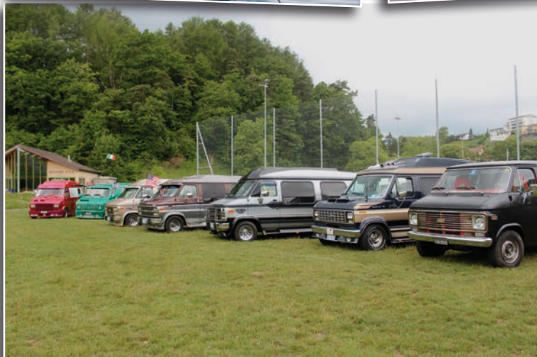
La réunion a eu lieu, le week-end dernier, au Puisoir à Orbe.