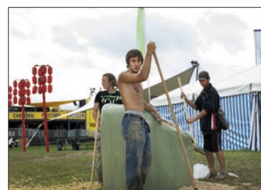
Une des photos du livre, signée Mercedes Riedy.

nicienne, agriculteur, enseignante, croque-mort ou dentiste, ils se sont retrouvés, chaque année, dans leurs mondes, là où, le temps d'une semaine, une quinzaine ou deux mois, les cartes se redistribuent et les complicités s'avivent. COM. ■