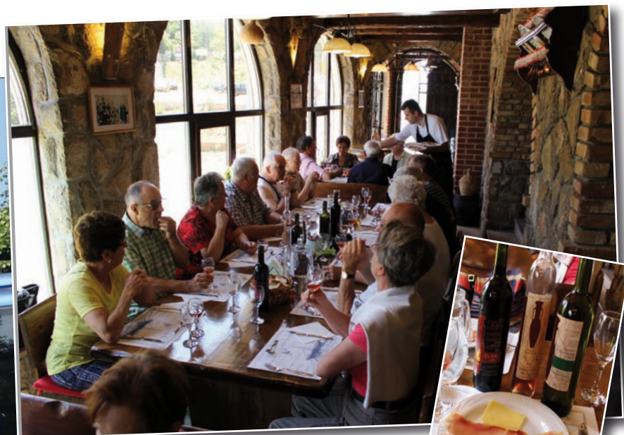
Dégustation de produits locaux, dont du jambon, du fromage et du Prosek.