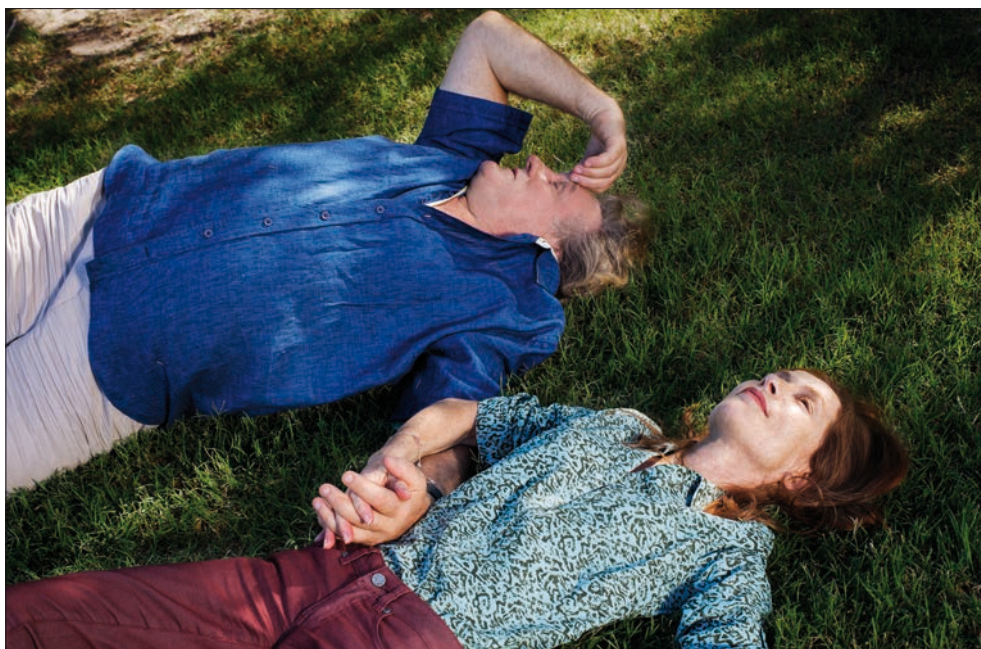
Gérard Depardieu et Isabelle Huppert se retrouvent 35 ans après «Loulou».