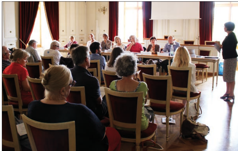
Une conférence, puis une table ronde ont réuni des personnalités suisses et italiennes impliquées dans la valorisation touristique de la Via Francigena.

La Via Francigena n'est pas aussi connue que le chemin de Compostelle, mais elle pourrait le devenir. Des personnalités des régions impliquées dans la valorisation touristique de cet itinéraire se sont réu-