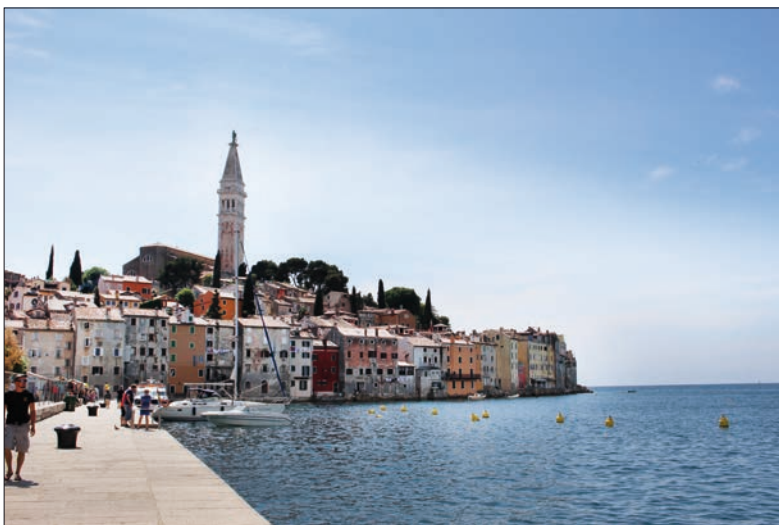
Rovinj et la Cathédrale Sainte-Euphémie.

CROATIE ■ Le traditionnel voyage des lecteurs de La Région Nord vaudois a emmené, le mois dernier, les curieux dans le golfe de Kvarner.