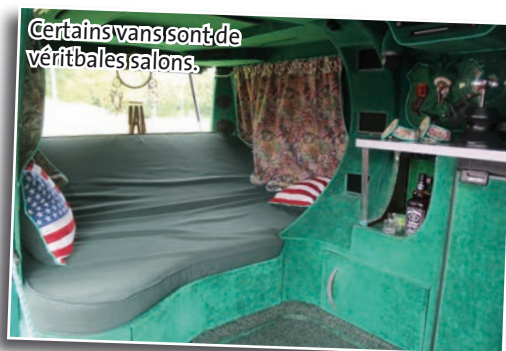
Certains vans sont de véritables salons.