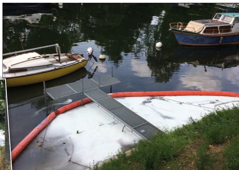
Le barrage a été posé à la hauteur de La Marive.