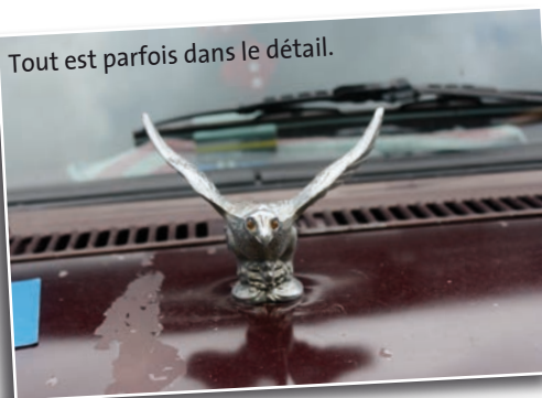
Tout est parfois dans le détail.