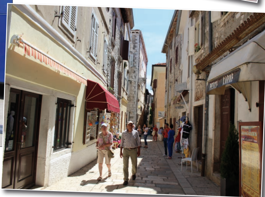
Promenade dans les ruelles de Porec.