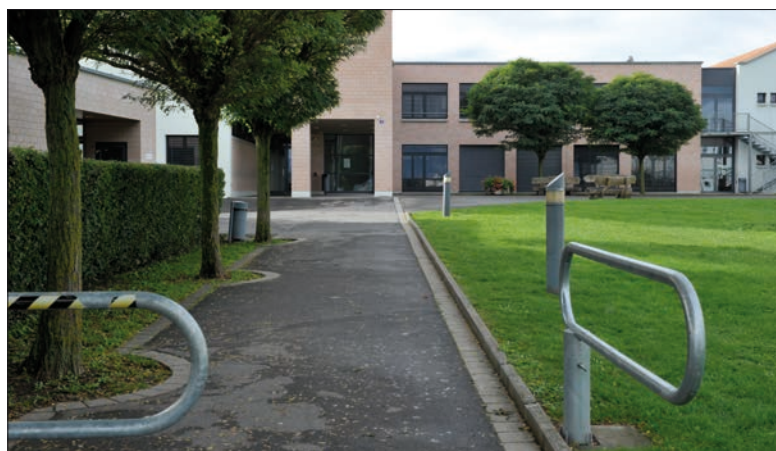
Le collège du Verneret, à Chavornay, est l'un des exemples de réalisation d'un bâtiment à des coûts très raisonnables.

La Cour ne se limite pas à distribuer bons et mauvais points, dans la mesure où une multitude de facteurs peuvent expliquer ces variations. Les délais de construction, les contraintes géologiques ou environnementales, le type de bâtiments (en «dur» ou modulaire), la présence de classes spéciales (sciences, travaux manuels, etc.), d'une salle de gym