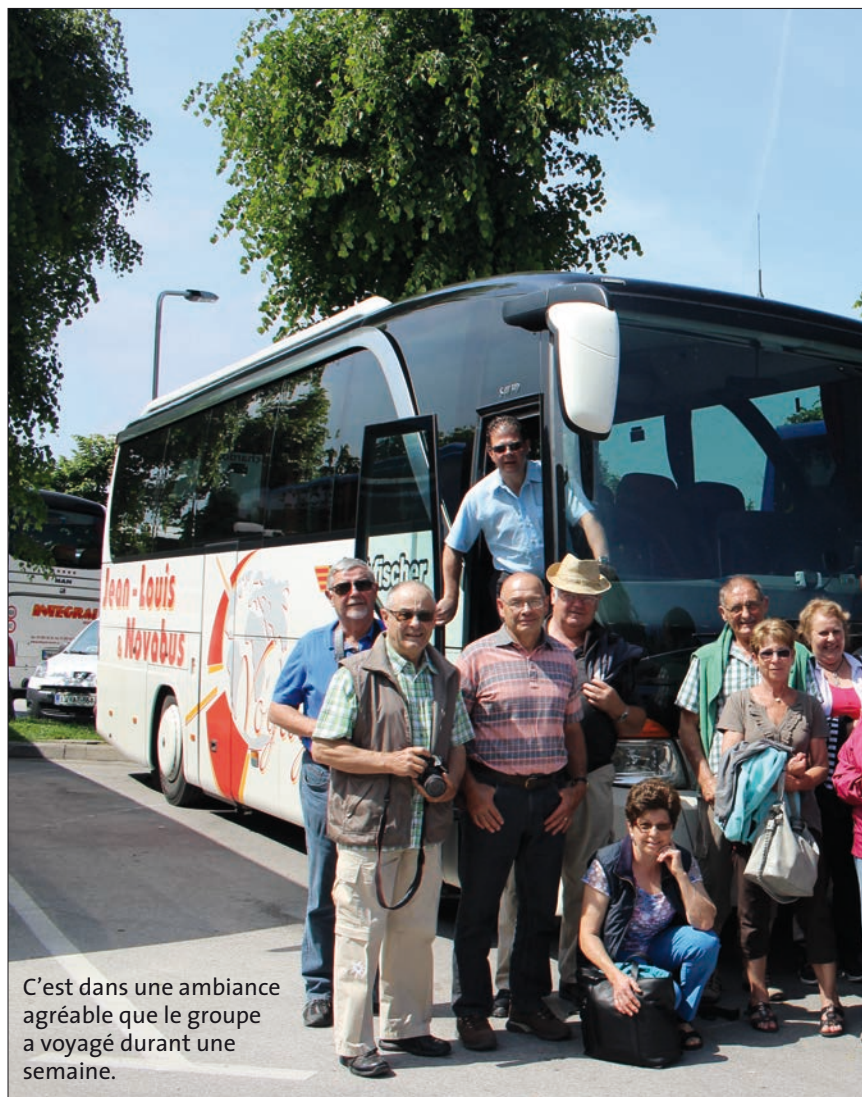
C'est dans une ambiance agréable que le groupe a voyagé durant une semaine.

Après avoir visité Krk, l'une des plus grandes îles de l'Adriatique, dégusté du jambon, et chargé le car de Prosek, un vin rosé doux qui se boit pour l'apéritif ou avec le dessert, le petit groupe de voyageurs quitte la Croatie.