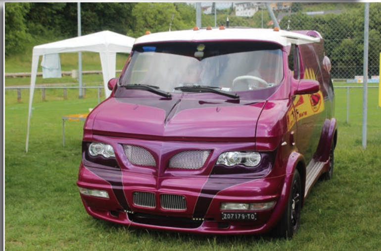
Certains modèles avaient de quoi faire rougir de jalousie les amateurs du genre.