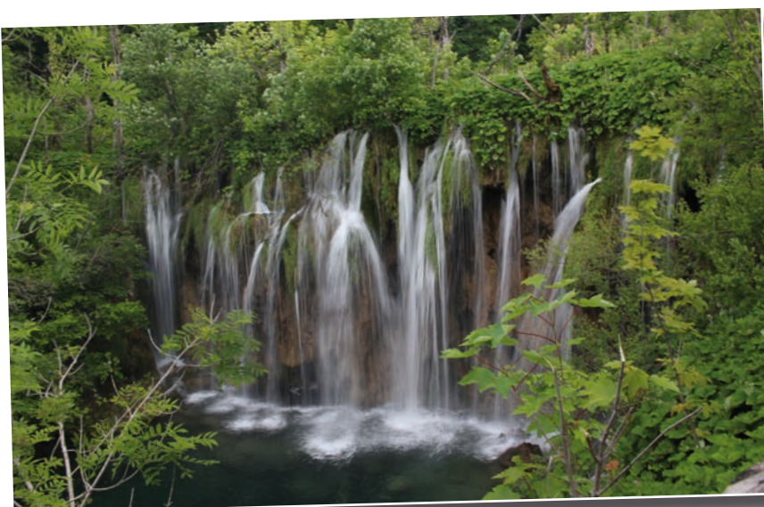
L'une des chutes d'eau dans le parc national de Plitvice.