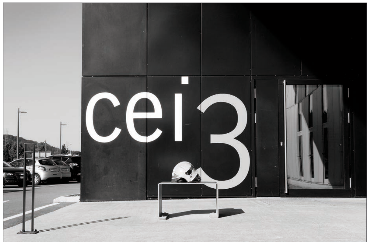
Yverdon-les-Bains, 24 juin, 08h23. Fausse alarme...