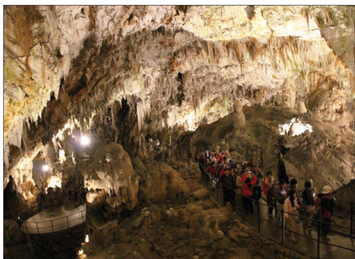
Les visiteurs se baladent sur 6 km dans les grottes de Postojna.