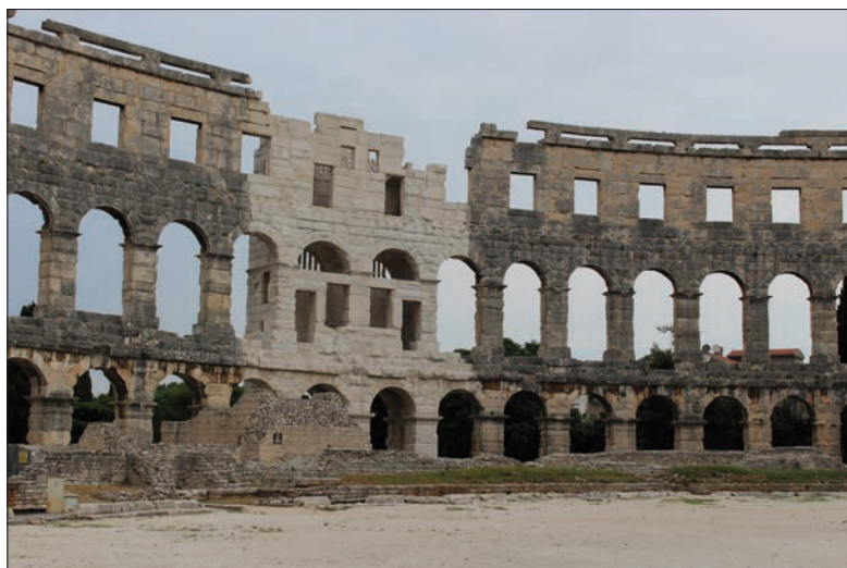
L'arène de Pula et sa tour nettoyée, pour lui rendre son apparence d'origine.

six kilomètres, et en petit train. Dans l'obscurité, les voyageurs, venus du monde entier, découvrent, grâce aux jeux de lumière, des formes les plus diverses et s'émerveillent en apercevant les Protées anguillards, également appelés sala-